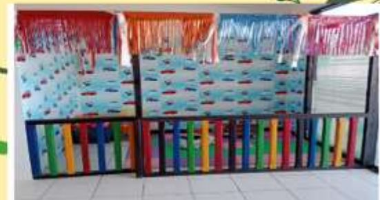
Tersedianya Arena Bermain Anak