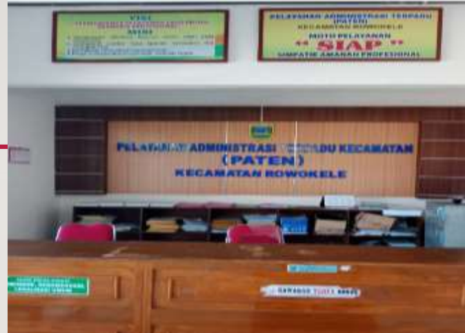
Zona PATEN Kec. Rowokele