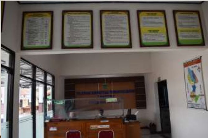
Tersedianya PaPan Informasi PATEN Kec. Rowokele