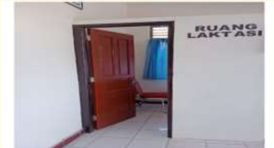
Tersedianya Ruang Laktasi Yang Nyaman