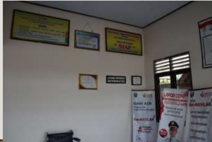
Tersedianya Maklumat Pelayanan Kec. Rowokele