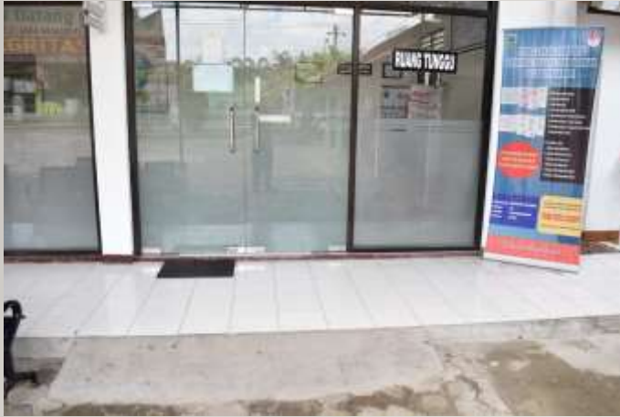
Tersedianya Jalur Khusus Disabilitas