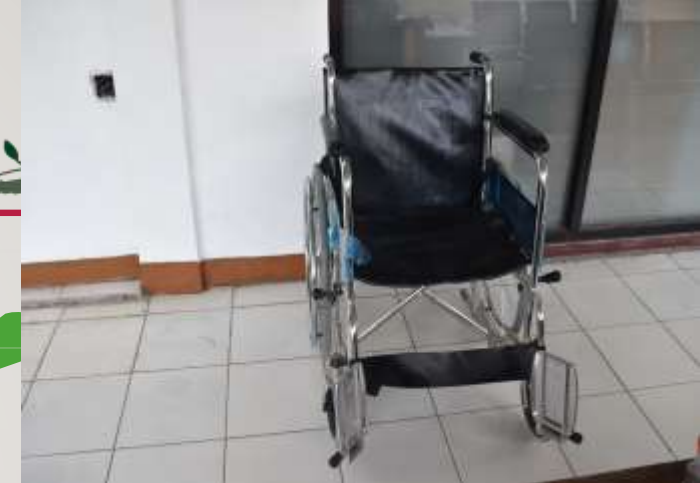
Tersedianya Kursi Roda Khusus Disabilitas