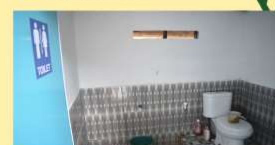
Tersedianya Toilet Duduk