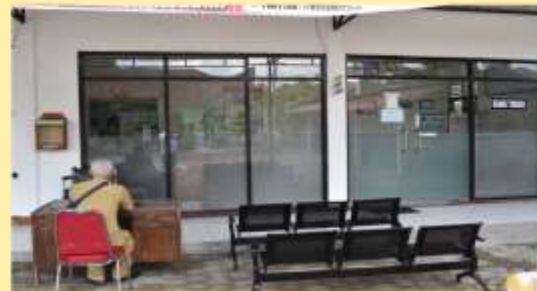
Tersedianya Ruang Tunggu Pelayanan Yang Nyaman