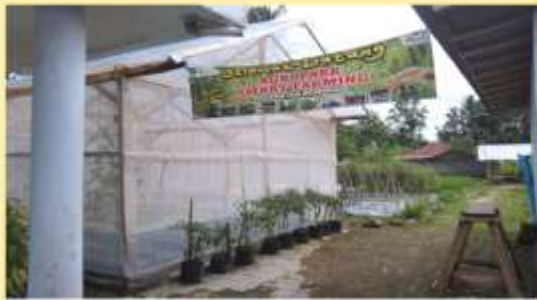
Adanya Agri Park