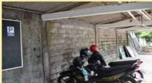
Tersedianya Area Parkir Yang Luas.