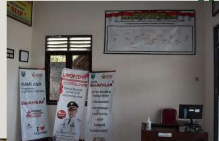
Zona Integritas WBK dan WBBM